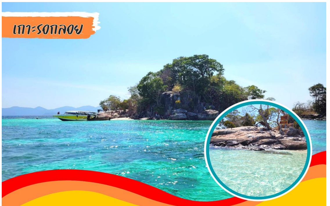
เกาะรอกลอย

สมควรแก่เวลานักคณะออกเดินทาง สู่ อ่าวลิง ..ให้ท่านได้ทดลองวิธีการใช้อุปกรณ์ดำน้ำตื้น ก่อนนำ ท่านไปดำน้ำดูปะการังที่ เกาะฝั่ง ที่มีปะการังหลากหลายพันธุ์และเหล่าปลาดุกการ์ตูนสีส้มสวยงามแปลกตา