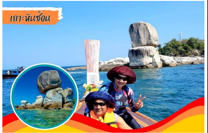
เกาะหินซ้อน

กรุ๊ป) เดินทางสู่ เกาะหินซ้อน ที่ ธรรมชาติสร้างสรรค์ได้อย่างน่า อัศจรรย์ อีสระให้ท่านถ่ายกับ ประติมากรรมทางธรรมชาติ ก่อนนำ ท่านเดินทางต่อสู่ เกาะรอกลอย เกาะที่ ได้ชื่อว่ามีน้ำทะเลที่ใสหาดทรายขาว ละเอียดและสวยงามที่สุดเกาะหนึ่งใน ..เหมาะแก่การเล่นน้ำ ถ่ายรูป หรือเดิน ขึ้นเขา..ชมวิวเป็นอย่างมาก