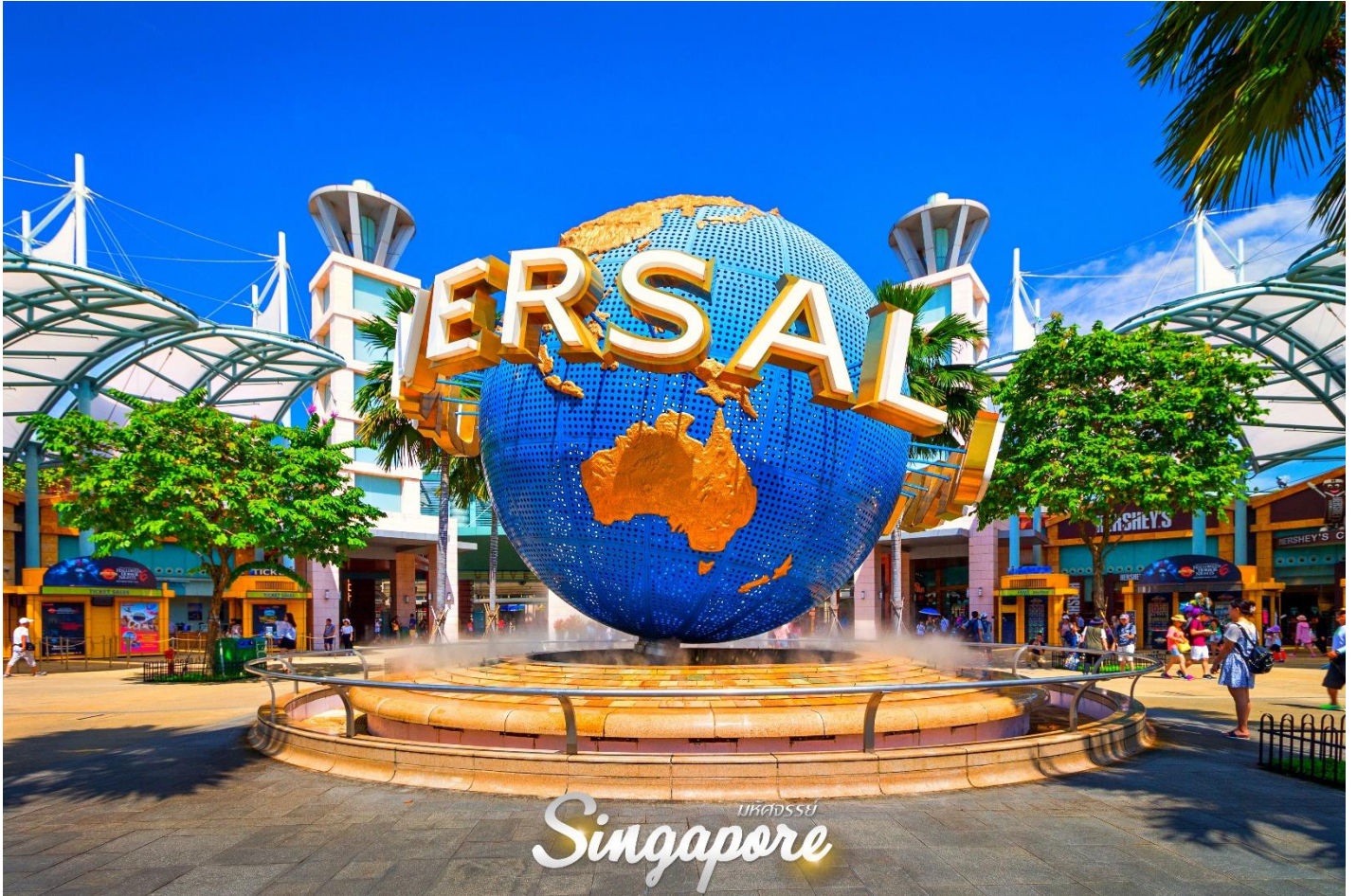
ประเทศสวitzerland Singapore