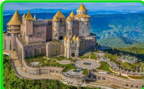
เที่ยวนานาอิสล่าแบบจุใจ เต็มวัน