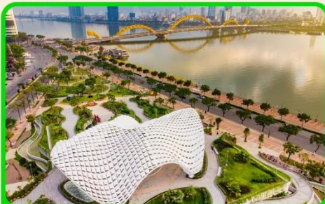
เซ็คอิน แหล่งที่เก๋ยวใหม่ APEC PARK