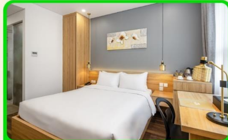
พักเมืองดานัง 4 ดาว 3 คืน