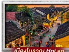
เมืองโบราณ Hoi an