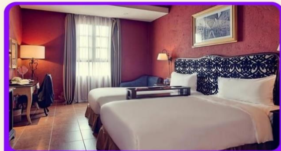
พักบนบานาฮิลล์ 1 คืน