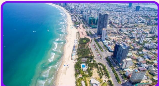
เช็किन ชายหาดหมีเคว เป็นชายหาดที่สวยงามที่สุดในเมืองดานัง