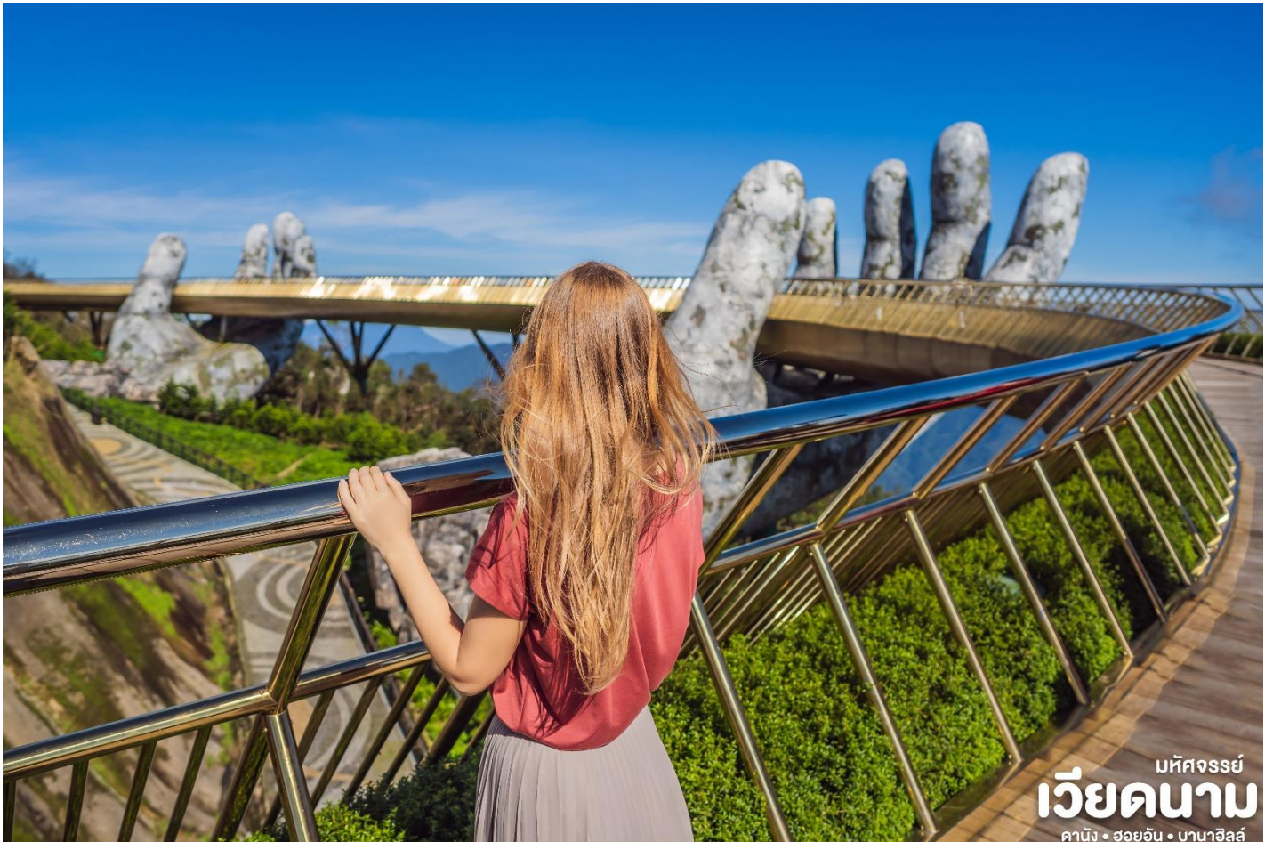
มหัศจรรย์ เวียดนาม ดานัง • ฮอยอัน • บานาฮิลล์

นำท่านชม สะพานสีทอง สถานที่ท่องเที่ยวใหม่ ล่าสุดตั้งโดดเด่นเป็นเอกลักษณ์อย่างสวยงาม บนเขาบานาฮิลล์ นำท่านสู่จุดที่สร้างความ ตื่นเต้นให้นักท่องเที่ยวมองดูอย่างอึ้งการที่ซึ่ง เต็มไปด้วยเสน่ห์แห่งตำนานและจินตนาการ ของการผจญภัยที่ สวนสนุก The Fantasy Park (รวมค่าเครื่องเล่นบนสวนสนุก ยกเว้น