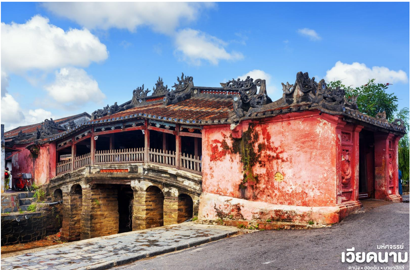
มหัศจรรย์ เวียดนาม ดานัง • ฮอยอัน • บานาฮิลล์

สร้างโดยชุมชนชาวญี่ปุ่นเมื่อ 400 กว่าปีมาแล้ว กลางสะพานมีศาลเจ้าศักดิ์สิทธิ์ ที่สร้างขึ้นเพื่อ สวดส่งวิญญาณมังกร ชาวญี่ปุ่นเชื่อว่า มี มังกรอยู่ใต้พิภพส่วนตัวอยู่ที่อินเดียและหางอยู่ที่ญี่ปุ่น ส่วนลำตัวอยู่ที่เวียดนาม เมื่อใดที่มังกรพลิกตัวจะเกิดน้ำท่วมหรือแผ่นดินไหว ชาวญี่ปุ่นจึงสร้าง สะพานนี้โดยตอกเสาเข็มลงกลางลำตัวเพื่อกำจัดมันจะได้ไม่เกิดภัยพิบัติขึ้นอีก ชมศาลกวนอูซึ่งอยู่ บนสะพาน ญี่ปุ่นและที่ฮอยอันชาวบ้านจะนำสินค้าต่าง ๆ ไว้ที่หน้าบ้าน เพื่อขายให้แก่นักท่องเที่ยว ท่านสามารถซื้อของที่ระลึก เป็นของฝากกลับบ้านได้อีกด้วย เช่น กระเป๋าโคมไฟ เป็นต้น