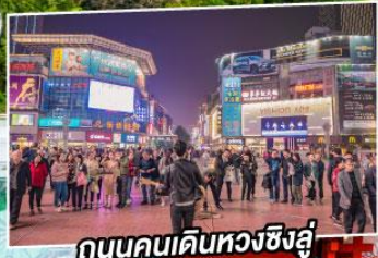
ถนนคนเดินหวงซิงอู่