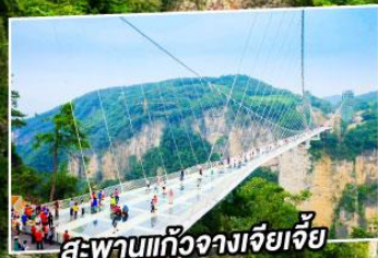
สะพานแกว่งเจียเจีย