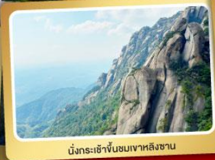
นั่งกระเช้าขึ้นชมเขาหวงหลิงซาน