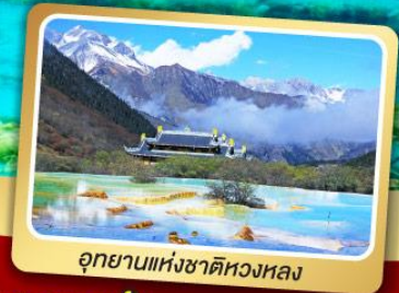
อุทยานแห่งชาติหลวงหล