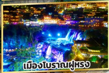
เมืองโบราณฝูหรง