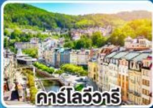
คาร์ลส์บัท