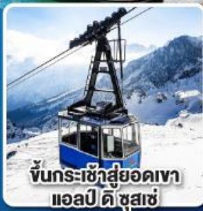
ขึ้นกระเช้าสู่ยอดเขา แอลป์ ดิ ซูสเซ่

เที่ยวเมืองอินส์บรุค เพชรเม็ดงามสุดโรแมนติก แห่งแคว้นทิโรล