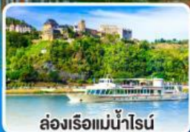
ล่องเรือแม่น้ำไรน์