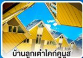
บ้านลูกเต่าโคกคูมุส