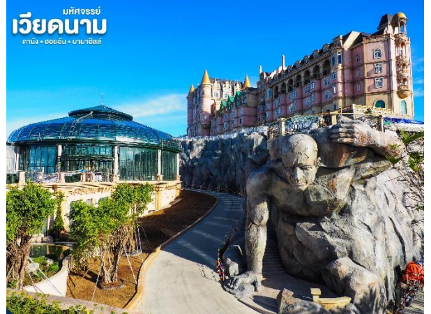
บังกอร์รี่ เวียดนาม ถนน • 006089 • บานาฮิลล์

ชมเมืองฝรั่งเศส เป็นตึกออกแบบมาได้ บรรยากาศยุโรปแท้ๆแต่มาเจอได้ใกล้ๆเพียงแค เวียดนาม ลัดเลาะไปตามตรอกซอกซอย มีมุม ถ่ายรูปเช็คอินสวยๆหลายมุม Le Jardin d' Amour เป็นสวนสวยสไตล์ฝรั่งเศส ที่มีทั้ง ดอกไม้ต้นไม้ มีมุมถ่ายรูปสวยๆ เต็มไปหมด รวม ไปถึงมี โรงไวน์ Debay Wine Cellar อีกด้วย เดิน ไปเที่ยวด้านในจะเป็นคล้ายๆ อุโมงค์ใต้ดินไว้บ่ม ไวน์ เป็นทางยาวเดินทะลุชมไปเรื่อยๆ ก็จะออกมาที่สวน นอกจากนี้ เดินไปไม่กี่ไกลยังมีพระพุทธรูป องค์ใหญ่สีขาวสูงถึง 27 เมตรอีกด้วย ให้ท่านเพลิดเพลินไปกับบานาฮิลล์ โซนใหม่ Eclipse Square ตามอัธยาศัย