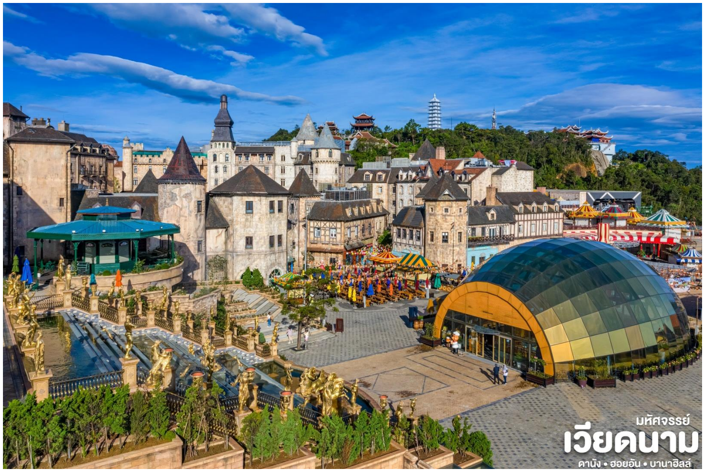
มหัศจรรย์ เวียดนาม คานัง • ฮอยอัน • บานาฮิลล์

จากนั้น นั่งกระเช้าขึ้นสู่บาน่าฮิลล์ กระเช้าแห่งบาน่าฮิลล์นี้ได้รับการบันทึกสถิติโลกโดยWorld Record ว่าเป็นกระเช้าไฟฟ้าที่ยาวที่สุด ประเภทNon Stopโดยไม่หยุดแวะมีความยาวทั้งสิ้น 5,042 เมตร และเป็นกระเช้าที่สูงที่สุด 1,294 เมตร นักท่องเที่ยวจะได้สัมผัสบรรยากาศและบางจุดมีเมฆลอยต่ำกว่ากระเช้าพร้อมอากาศบริสุทธิ์อันสดชื่นจนทำให้ท่านอาจลืมไปเสียด้วยซ้ำว่าที่นี่ไม่ใช่ยุโรป เพราะอากาศที่หนาวเย็นเฉลี่ยตลอดทั้งปีประมาณ 10 องศาเท่านั้น