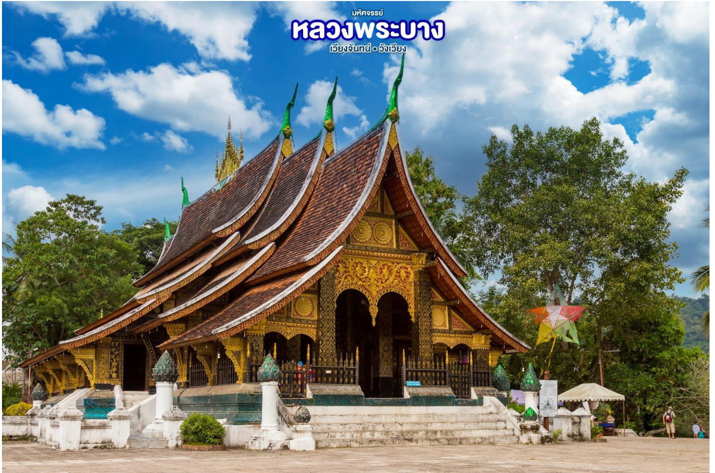
บึงคอง หลวงพระบาง เวียงจันทน์ • อ.เชียงเวียง

จากนั้น นำท่านเดินทางสู่สถานีรถไฟความเร็วสูง เตรียมตัวมุ่งหน้าสู่เวียง (ใช้เวลาเดินทางประมาณ 1 ชั่วโมง) ให้ท่านได้ชมบรรยากาศ ธรรมชาติตลอดสองข้างทางในรถไฟ