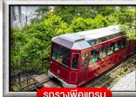
รถรางพิกแนม