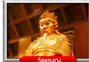
วัดเข่งกง