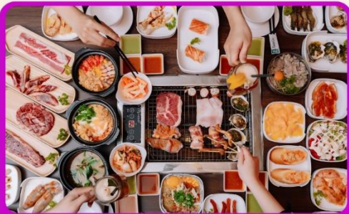
พิเศษ!! เมบูซาซิมิ+บุฟเฟ่ต์ปิ้งย่าง