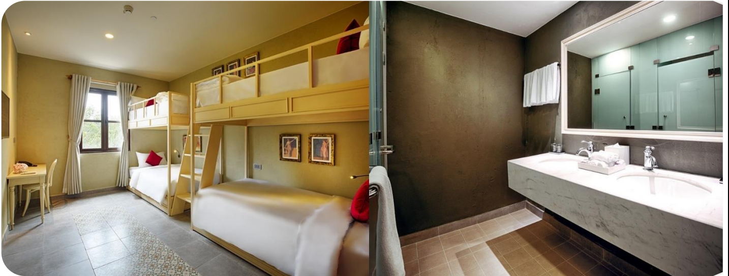
ห้องแบบ Standard Rooms