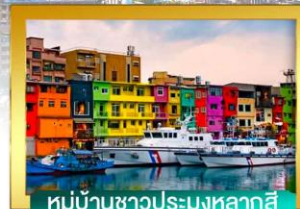
หมู่บ้านชาวประมงหลงล้าสึ

เดินทางโดยสายการบินเวียดเจ็ทแอร์ อาหาร : 7 มื้อ โรงแรม : 3 คาว