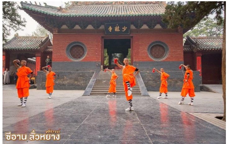
ซีอาน ลั่วหยาง

เยือน อุทยานป่าเจดีย์ “ถ้ำหลิน” (รวมรถอุทยาน) มีเจดีย์กว่า 200 องค์ ที่มีความเก่าแก่มากกว่า 1,500 ปี เป็นสุสานอดีตของเจ้าอาวาสและหลวงจีนมาตั้งแต่ยุคสมัยของราชวงศ์ถัง