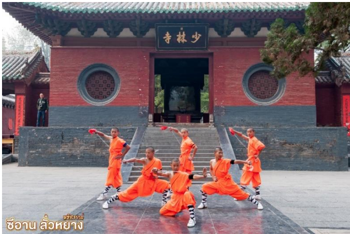
ซีอาน ลั่วหยาง

จากนั้น นำท่านสู่ วัดเส้าหลิน “เสี่ยวลิมอี้” เป็นวัดพุทธนิกายเซ็นอันดับหนึ่งของประเทศจีนอายุกว่า 1,500 ปี ในอดีตเป็นที่พักของ “ท่านปรมาจารย์ตั๊กม้อ” จากอินเดียที่เดินทางมาเผยแผ่พุทธศาสนาในประเทศจีน และเป็นเจ้าอาวาสท่านแรกแห่งวัดเส้าหลิน มีความเป็นเลิศทางวิทยายุทธ์ อันเป็นต้นกำเนิดกังฟูเส้าหลินอันโด่งดัง ท่านคือผู้คิดค้นเพลงหมัดมวยขึ้นมาเพื่อใช้ออกกำลังกาย และใช้ป้องกันตัวจากสัตว์ร้าย พิเศษ! ชมโชว์กังฟูเส้าหลิน ที่มีชื่อเสียง