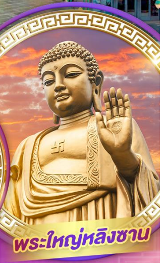
พระใหญ่หลิงซาน