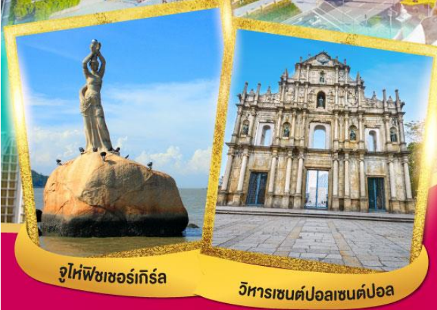
จูไห่พีชเชอร์เกิร์ส