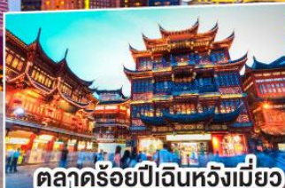
ตลาดร้อยปีฉินหวงเหมียว