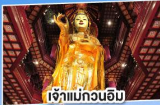
เจ้าแม่กวนอิม