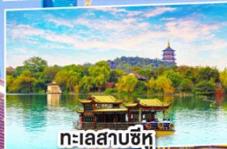
ทะเลสาบซีหู