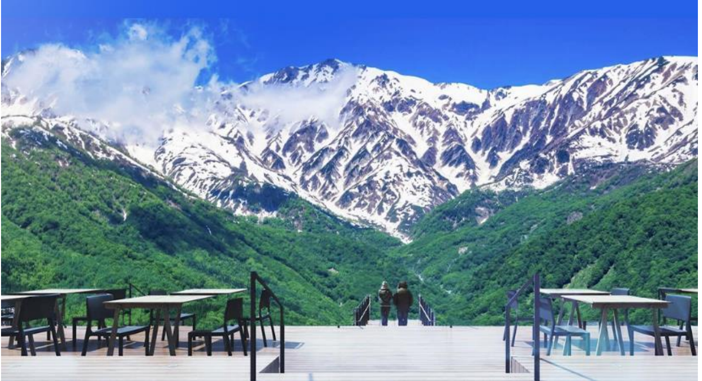
HAKUBA MOUNTAIN HARBOR