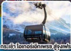
กระเช้า ไอเกอร์เอ็กสเพรส สู่อยอดเขาจุงเฟรา

อิตาลี สวิตเซอร์แลนด์ ฝรั่งเศส 10 วัน 7 คืน