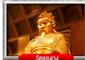
วัดเข่งกง