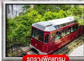
รถรางพิกเจอร์