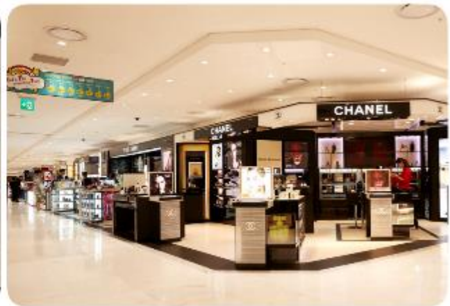
ทัศนียภาพโดยรอบ