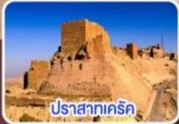
ปราสาทครีค