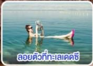
ล่องตัวที่ทะเลเดดซี