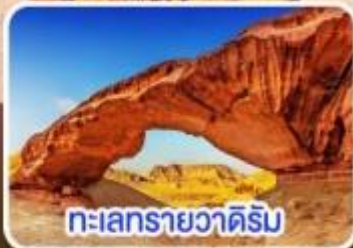
ทะเลทรายวาดีรัม