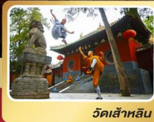
วัดเส้าหลิน