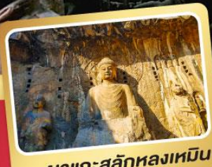
พิพิธภัณฑ์หลินเหยียน