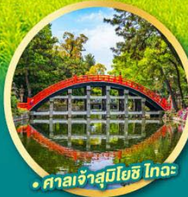
• ศาลเจ้าสุมิโยชิ โทคะ