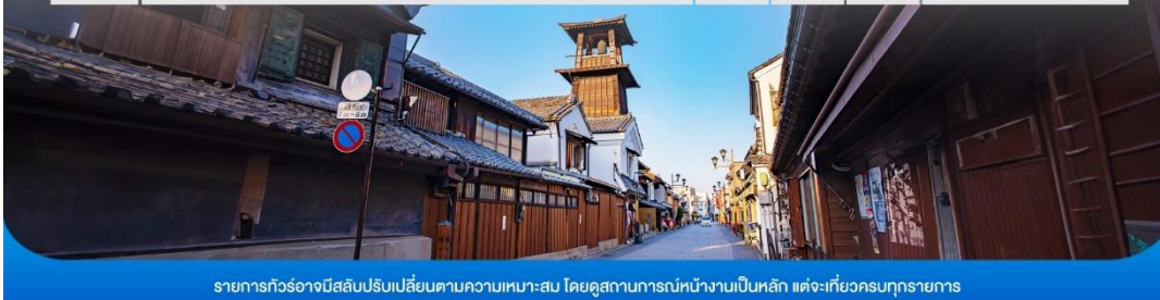
รายการทัวร์อาจมีปรับเปลี่ยนตามความเหมาะสม โดยดูสถานการณ์หน้างานเป็นหลัก แต่จะเกี่ยวข้องครบทุกรายการ